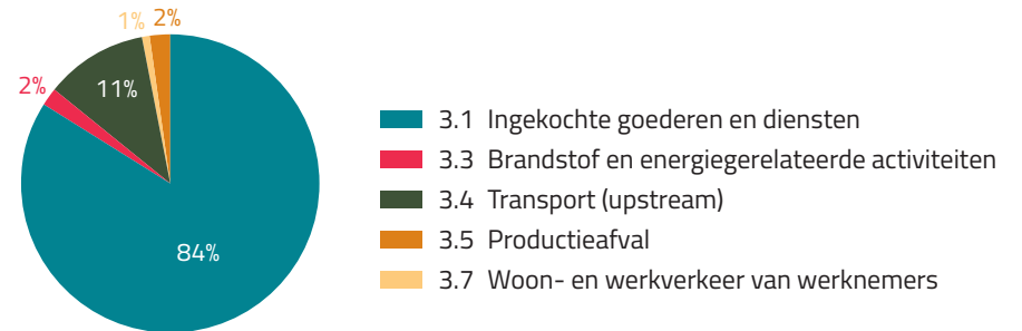
Verhouding uitstoot scope 3

Verantwoording over de totstandkoming van deze berekeningen zie: bijlage 2.